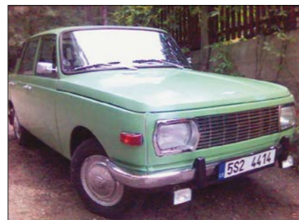
Wartburg 353 v plné kráse

jednu z nejkrásnějších – zámek Hluboká. Navštívili jsme ještě mnoho zajímavostí, celkem jich za ten týden bylo 27. Poslední den naší dovolené