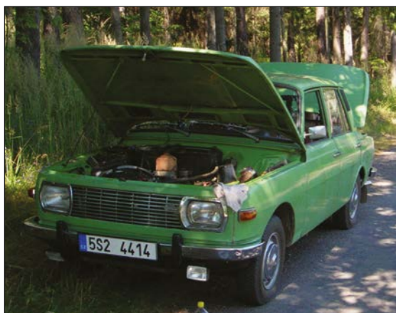
Wartburg 353 vře

Dlouho jsme s přítelkyní přemýšleli, kam pojedeme na dovolenou. Nápad o zájezdu k moři byl hned po vyřknutí zavržen, neboť celý den ležet u moře není nic pro nás. Měli jsme touhu zažít nějakou netradiční a bláznivou dovolenou. V tom se vlastně zrodila myšlenka, že podnikneme cestu po Čechách a navštívíme krásy naší země, a to zejména hrady a zámky. Díky svému umístění se stal naším cílem Temelín.